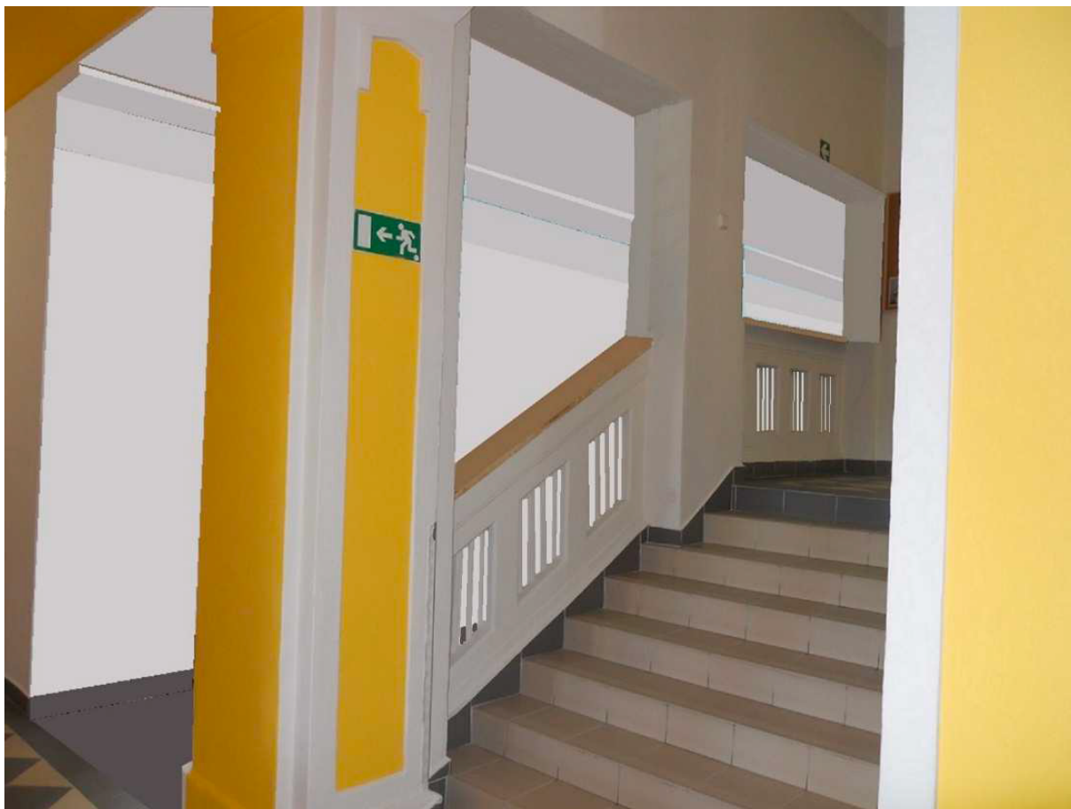
K položce 107 – demolice schodiště v dílně školníka.